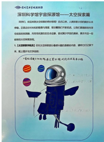
图 5.学生太空探索图成果

学生整合在各个展区完成的灵感和草图，围绕驱动性问题，绘制一幅人类探索与发展的“未来蓝图”：用图像、关键词和流程线，清晰地展示构想的未来世界。