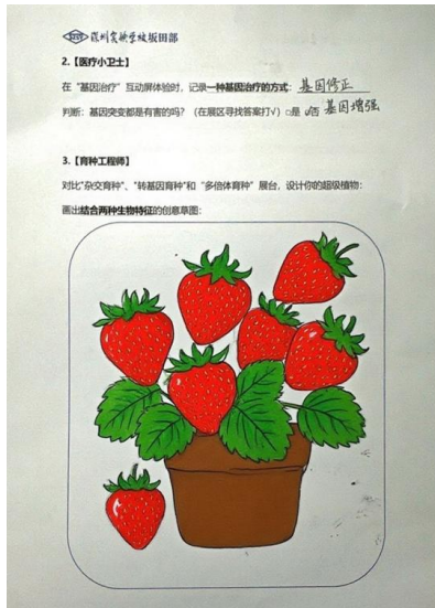
图 4.学生三倍体草莓图成果